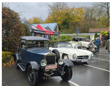
Oldtimer vor Dieckmann