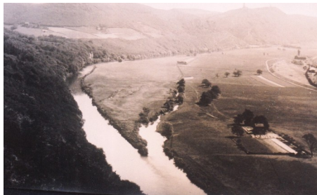
Früherer Ruhrverlauf am heutigen Köppchenwerk, rechts unten Haus Niedernhof.

gefundenen Missstände wurden in Hamm besprochen: Engstellen und Felsen in der Ruhr, aufgrund nicht gemähter Wiesen zugewucherte Leinpfade, Kribben (in den Fluß gebaute Steindämme) in schlechtem Zustand. Dem