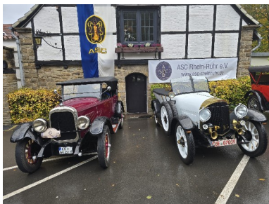
Oldtimer vor Dieckmann

https://www.asc-rheinruhr.de/jubiläum-100-jahre-hohensyburg-rundkurs .