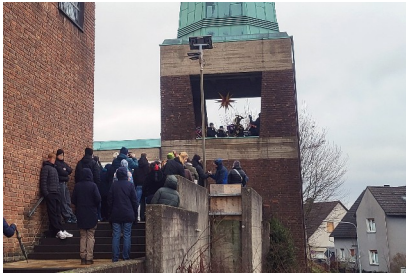
Das Turmblasen vor Publikum

Am Neujahrstag gab es nach 2017 zum dritten Mal das „Turmblasen des Posaunenchores Grundschöttel/Oberwengern“.