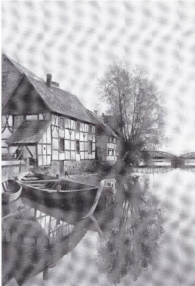
Transportkahn im Mühlengraben in Herdecke (um 1913).

Schiffsunfälle auf der alten Ruhr zwischen Langschede und (Duisburg-) Ruhrort waren keine Seltenheit. In einem Jahr verunglückten bis zu 8