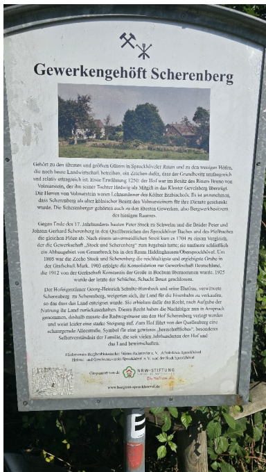
Informationstafel am Radweg (Bahnhof Schee)