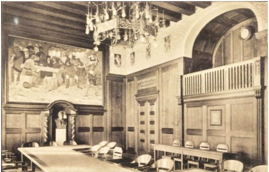
Ratssaal in Rathaus Wetter

Bitte denkt an die Mitgliederversammlung am 17. Februar in der Hegestraße. Die Tagesordnung ist in diesem Heft nochmal abgedruckt.