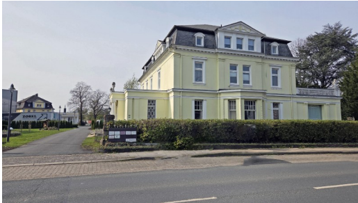
ehem. Villa Peyinghaus