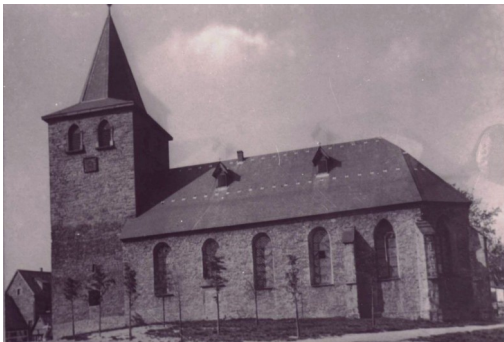
alte Dorfkirche in Wetter

Wegen immer größerer Baumängel und weil die Anzahl der Gemeindeglieder stark gewachsen war, entschloss die Gemeinde